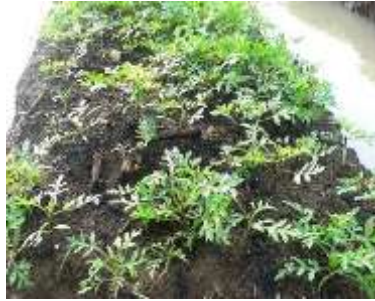
Gambar 18. Tanaman kenikir/suring dengan pupuk formula A yang berumur 1 minggu