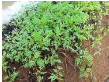
Gambar 20. Tanaman kenikir/suring dengan pupuk formula B yang berumur 1 minggu