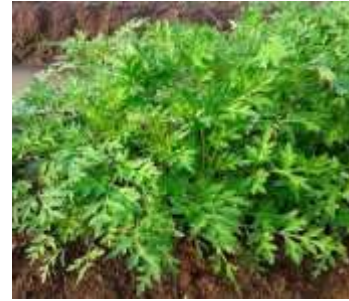
Gambar 19. Tanaman kenikir/suring dengan pupuk formula A yang siap panen