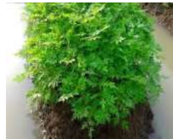
Gambar 21. Tanaman kenikir/suring dengan pupuk formula B yang siap panen