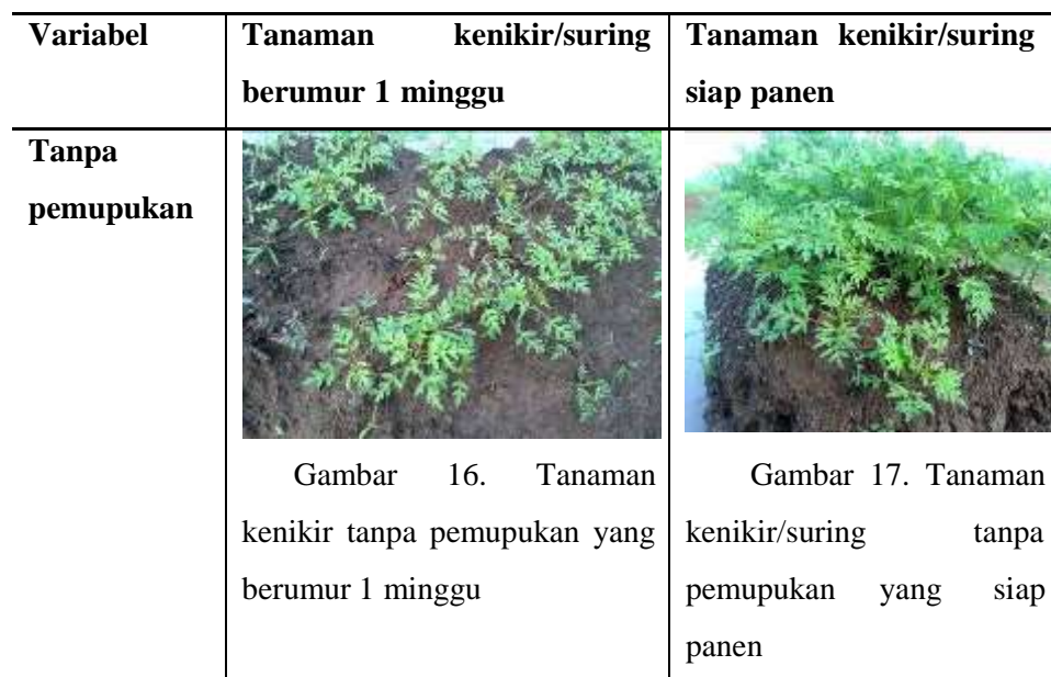
Tabel 7. Hasil pengujian pupuk organik terhadap pertumbuhan tanaman kenikir /suring

Variabel yang perlu diperhatikan dalam pengujian biologi terhadap pertumbuhan tanaman kenikir/suring ialah media tanam yang sesuai dan cukup air serta mendapatkan sinar matahari yang cukup untuk memaksimalkan pertumbuhannya. Media tanam yang dipilih ialah tanah persawahan yang telah didesain atau dibuat sedemikian rupa untuk penanaman tanaman sejenis ini. Variabel manipulasi disini meliputi: tanaman kenikir/suring tanpa pemupukan, tanaman suring dengan pupuk formula A dan tanaman suring dengan pupuk formula B.